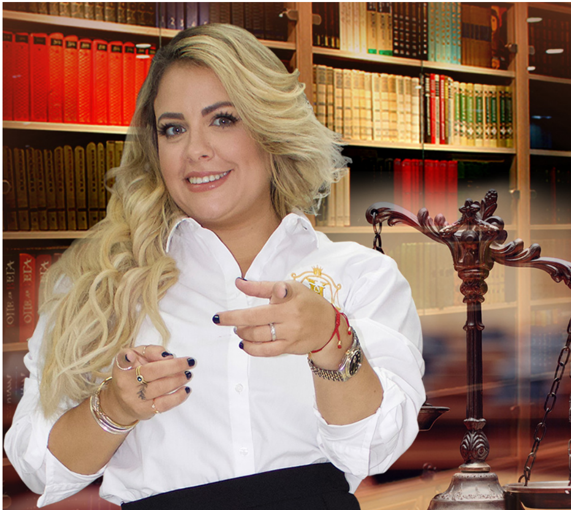
Xenia Hernández Law: El despacho de abogados que está cambiando vidas.